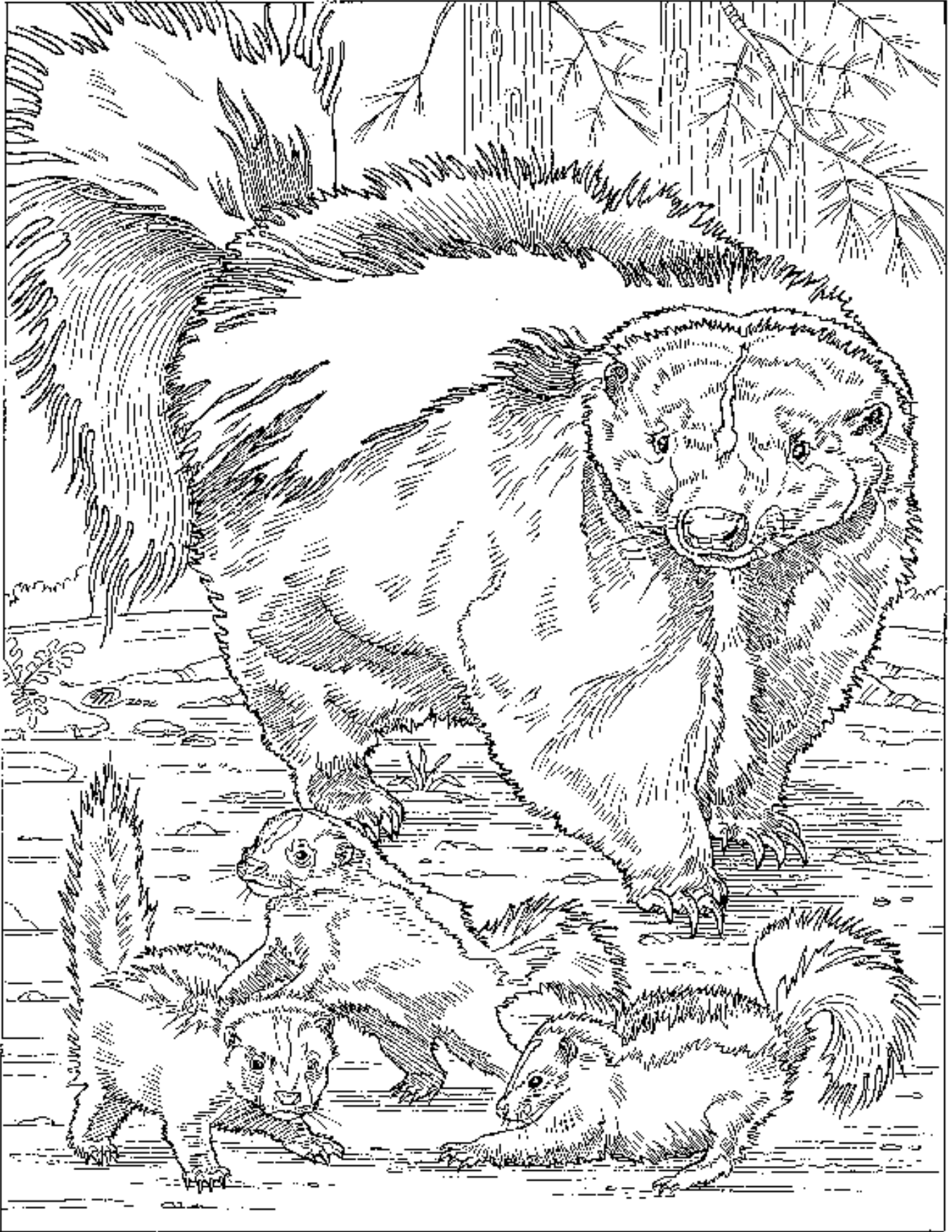
Striped Skunk – Zorrillo Rayado